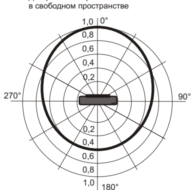
Рис.2 Схема подключения и диаграмма направленности звука оповещателя.

Диаграмма направленности в свободном пространстве